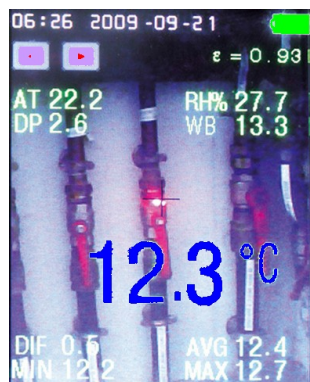
Modo IR CAM