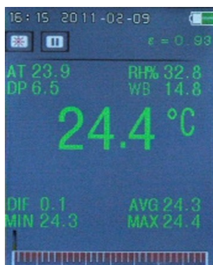
Modo medición infrarroja